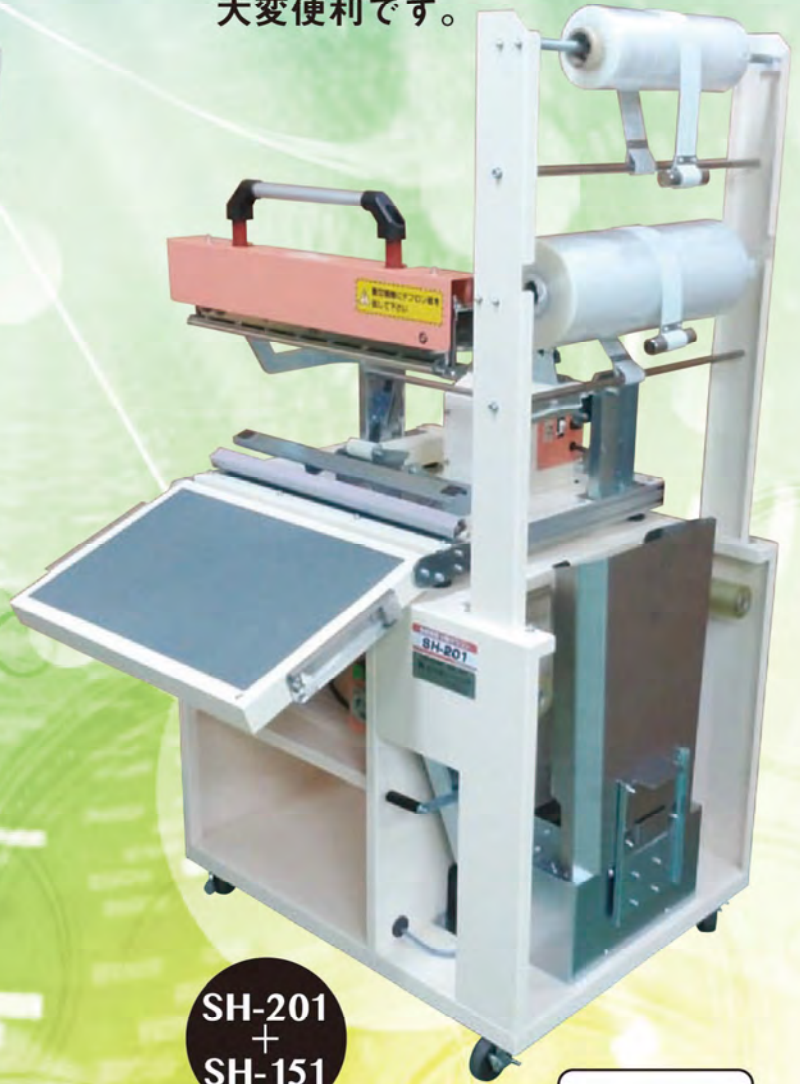
SH-201 + SH-151